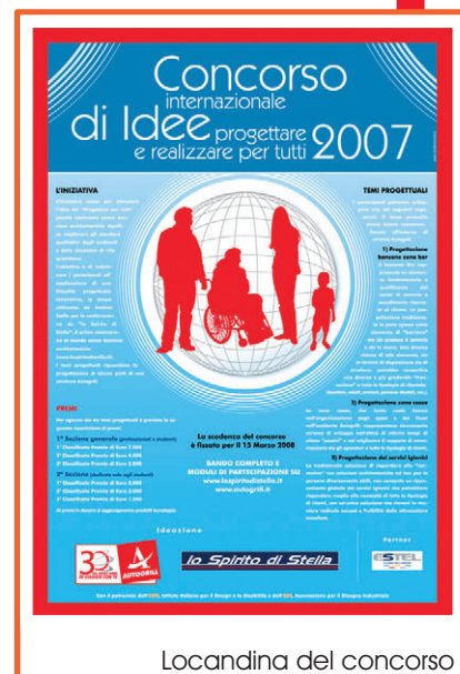
Locandina del concorso

La tecnologia, e più ancora il buon senso, sono riusciti a costruire una barca a vela dove un disabile, o una qualsiasi persona con difficoltà di movimento, è a proprio agio, percependo quel senso di libertà che gli viene precluso quando incontra ostacoli.